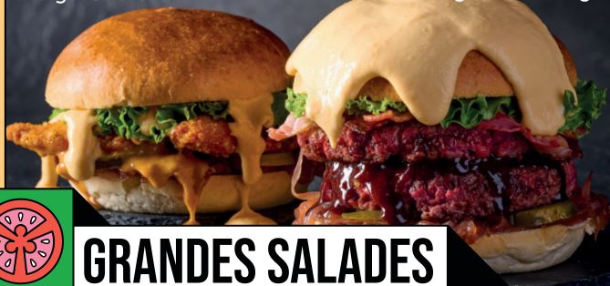
Burger Double Original