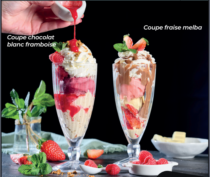
Coupe chocolat blanc framboise