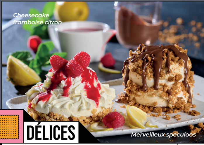
Cheesecake framboise citron