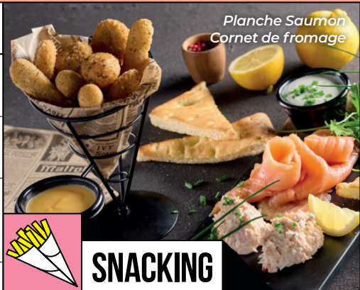
Planche Saumon Cornet de fromage