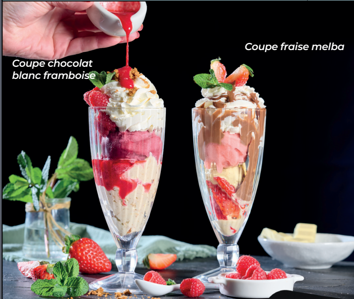
Coupe chocolat blanc framboise