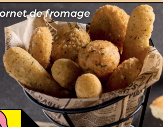
Cornet de fromage