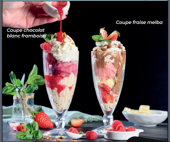
Coupe chocolat blanc framboise