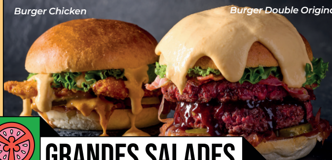
Burger Double Original